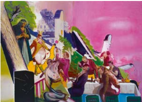
Neo Rauch Die Vorführung | 2006 Öl auf Leinwand 300 x 420 cm Rubell Family Collection, Miami

Große Neo-Rauch-Ausstellung in München und Leipzig