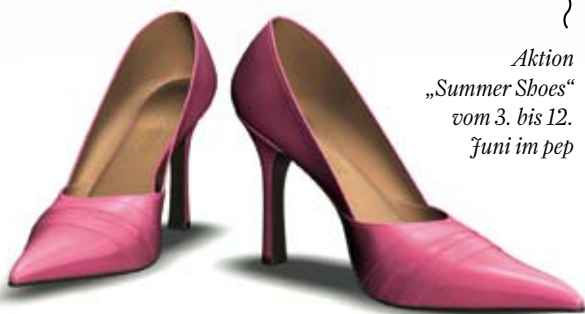
Aktion „Summer Shoes“ vom 3. bis 12. Juni im pep

von klassisch bis sportlich, von High Heel bis Sneaker. Lassen Sie sich inspirieren: Schuhliebhaber(innen) erwartet eine moderne und trendbewusste Vorstellung zahlreicher neuer Modelle für (fast) jeden Anlass. Krönender Höhepunkt der Aktion, die übrigens den vielversprechenden Titel „Summer Shoes“ trägt, ist eine Schuhmodenschau am pep-Point. Da fängt das Herzchen an zu klopfen, stimmt's, verehrte Damen?