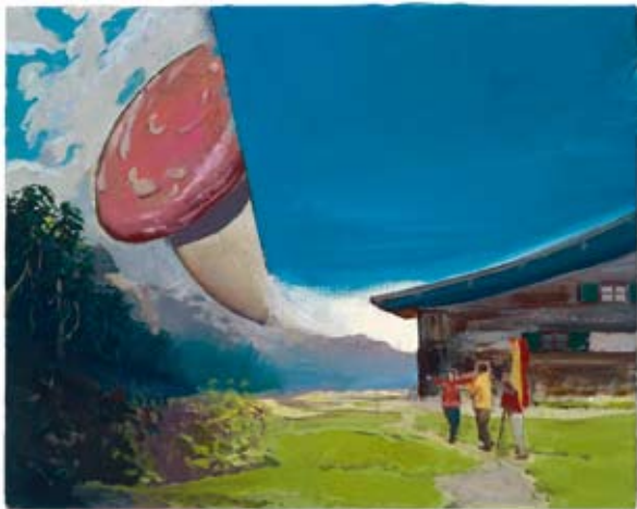
Neo Rauch Glück | 2006 Öl auf Leinwand 40 x 50 cm Privatsammlung Deutschland

Kaum mehr als zehn Werke verlassen pro Jahr das Atelier von Neo Rauch. Der internationale Topstar unter den deutschen Gegenwartskünstlern ist ein langsamer Maler. Umso besser, dass anlässlich seines 50. Geburtstags eine große Retrospektive ansteht: In Neo Rauchs Heimatstadt Leipzig sowie zeitgleich in der Pinakothek der Moderne in München werden etwa 120 Werke aus den Jahren 1993 bis 2010 gezeigt. Den Schwerpunkt der beiden aufeinander abgestimmten Ausstellungen bilden aktuelle Arbeiten aus amerikanischen Privatsammlungen, die bislang noch in keinem europäischen Museum zu sehen waren.